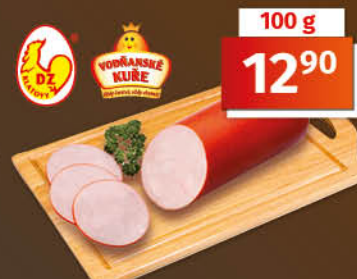
Kuřecí debrecínka 1 kg = 129,00