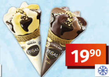
Pribináček zmrzka 50 ml, mražený, vanilková příchuť, v polevě 1 l = 298,00