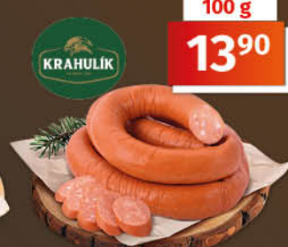
Špekáčkový pikantní točený salám 1 kg = 139,00