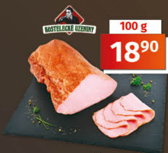
Kladenská pečeně 1 kg = 189,00