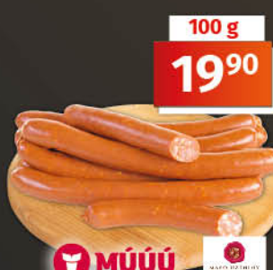
Debrecínské párky 1 kg = 199,00