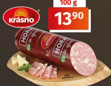
Horal se sýrem 1 kg = 139,00