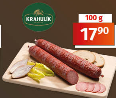
Vysočina 1 kg = 179,00