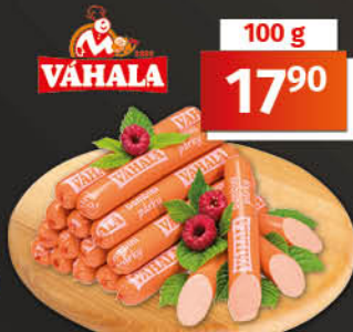
Bambiní párky 1 kg = 179,00