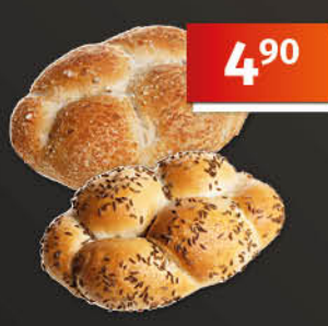
Raženka 63 g, vybrané druhy 1 kg = 77,78 Pouze ve vybrané síti prodejen