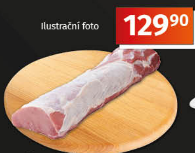
Gourmet Vepřová pečeně bez kosti balená, chlazená 1 kg = 129,90