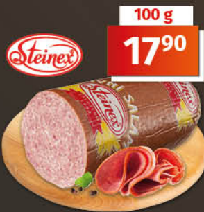
Pivní salám 1 kg = 179,00