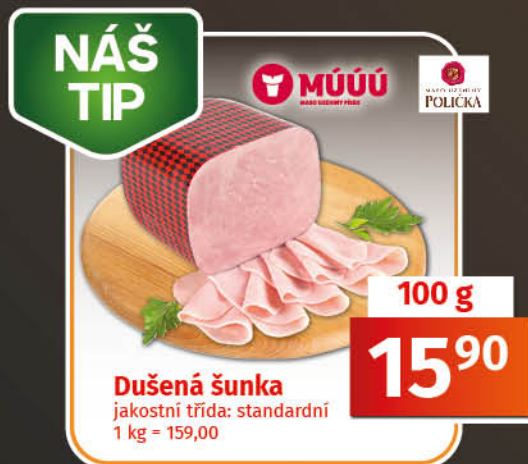
Dušená šunka jakostní třída: standardní 1 kg = 159,00