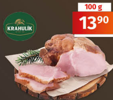
Uzené vepřové ocásky 1 kg = 139,00