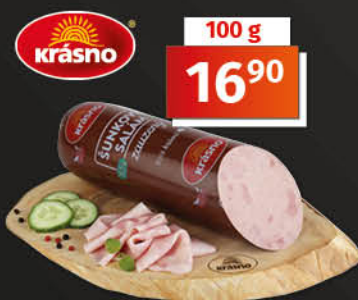
Šunkový salám zauzený 1 kg = 169,00