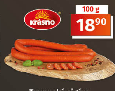
Trampské cigáro 1 kg = 189,00