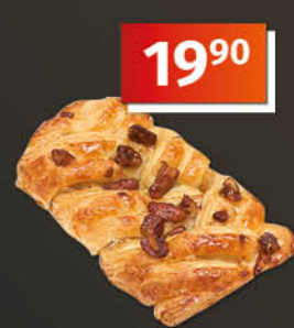
Javorový pecan 81 g 1 kg = 245,68 Pouze ve vybrané síti prodejen