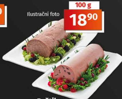
Paštika vybrané druhy 1 kg = 189,00