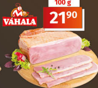
Mistrovo uzené 1 kg = 219,00