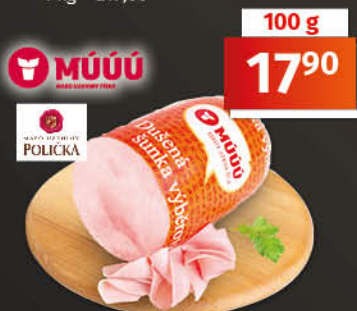
Dušená šunka jakostní třída: výběrová 1 kg = 179,00