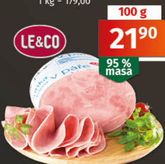
Šunka dušená v páře jakostní třída: nejvyšší 1 kg = 219,00