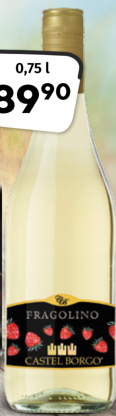
CASTEL BORG Fragolino bianco, rosso IGRISTOE-TRADING CZ 1 l = 119,87