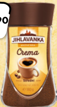
JIHLAVANKA Crema instantní káva TCHIBO PRAHA 100 g = 61,06