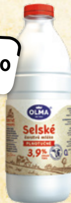
OLMA Selské mléko čerstvé plnotučné OLMA 1 l = 33,90