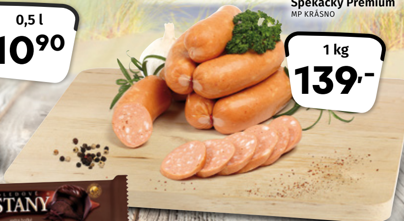
Špekáčky Premium MP KRÁSNŮ