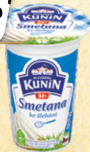
KUNÍN Smetana 31% ke šlehání LACTALIS CZ 100 g = 14,95