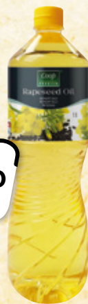
COOP PREMIUM Řepkový olej FABIO PRODUKT 1 l = 39,90