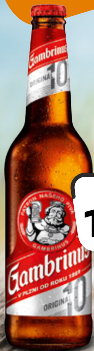
Gambrinus Originál 10 světlé výčepní pivo PLZEŇSKÝ PRAZDROJ 1 l = 21,80